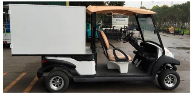
Teycars Baleares 2+caja equipado con caja cerrada rígida para el transporte de comida