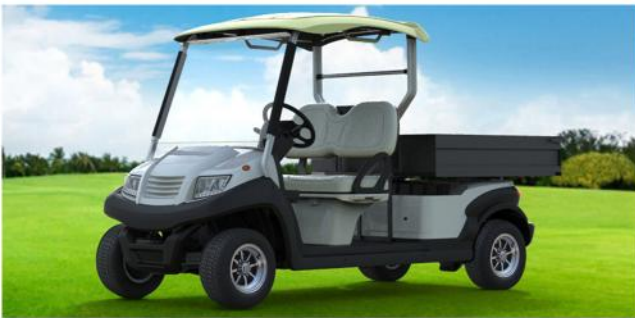
Teycars Baleares 2+caja realizando tareas de mantenimiento en las instalaciones de un camping