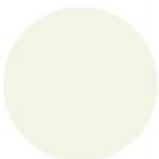
TEYCARS Pure White