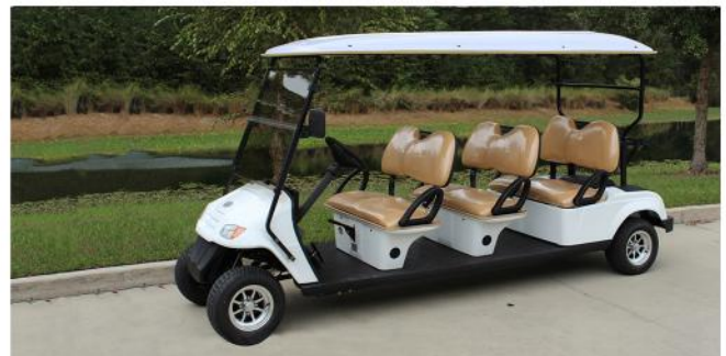
Teycars Baleares 6 como vehículo shuttle en las instalaciones de un resort con club de golf