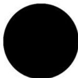
TEYCARS All Black