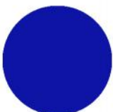
TEYCARS Midnight Blue