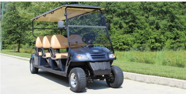
Teycars Baleares 6 realizando tareas de movilidad interna en las instalaciones de un campus universitario