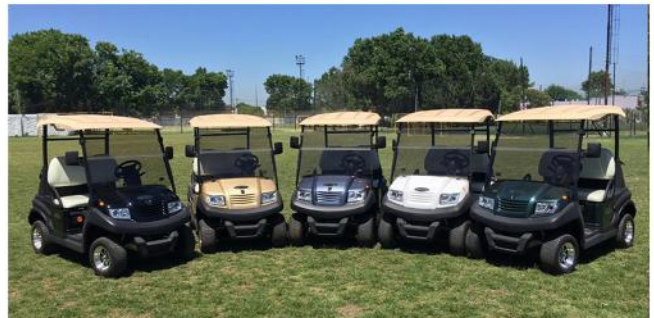
Una pequeña flotilla de 5 'Valencias 2 golf' con una pequeña muestra de los colores en que puede pintarse su carrocería