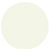
TEYCARS Pure White