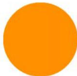
TEYCARS Summer Orange