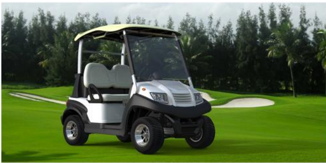
Teycars Valencia 2 golf en su hábitat natural: el green de un campo de Golf.