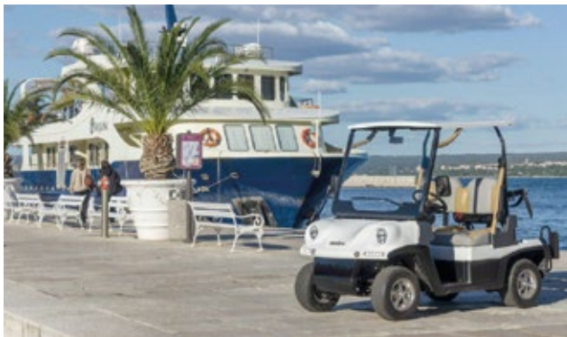
MELEX 447 en una marina deportiva como vehículo de cortesía.