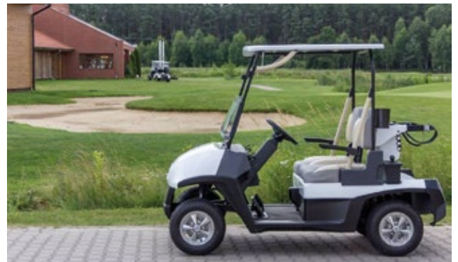
De paseo con el MELEX 447 por las instalaciones del Club.